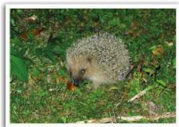
Je déguste les bonnes mirabelles du jardin...