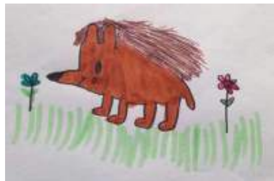
'Le gentil hérisson de Papou' Clémence 6 ans

C'est un grand marcheur de nuit. Il peut aménager jusqu'à une dizaine de gîtes pour en choisir un pour élever les petits et en choisir un autre pour passer l'hiver, où il ne faut surtout pas le déranger.